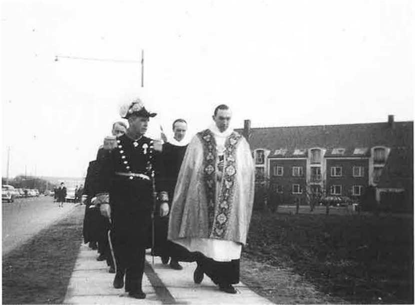
Procession med stiftamtmand og biskop i spidsen ved indvielsen af Munkebjerg kirke i marts 1961.

Hvad nye kirker angår, blev det ikke til mange i min tid, ialt kun fire og alle i Odense – naturligvis, for det øvrige Fyn var jo i forvejen forsynet med kirker. De to første, Bolbro kirke og Munkebjerg kirke, blev indviet med kun en uges mellemrum i 1961, men så skal vi helt frem til 1975, da Vollsmose kirke kunne tages i brug, og i 1983 fulgte Hjallese kirke. Jeg tror, at vi med hensyn til kirkebygninger på rimelig måde har dækket Odenses behov, og jeg har altid understreget, at der må gå meget grundige overvejelser forud, inden der tages beslutning om at opføre en ny kirke.