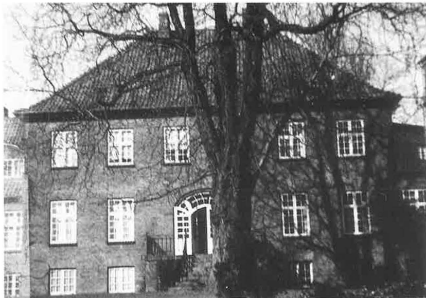
Odense bispegård i Klaregade, fotograferet fra havesiden 1965.

dater, som forventedes at forholde sig aldeles passive, indtil afgørelsen var truffet, hvad vi også pænt rettede os efter, og da resultatet af menighedsrådenes afstemning forelå, viste det sig, at kun et meget lille antal stemmer skilte mig fra min udmærkede medkandidat. Formelt var kirkeministeren nu frit stillet med hensyn til, hvem af os der skulle indstilles til udnævnelse; men da der var en ubrudt tradition for at pege på den med det største antal stemmer, blev det mig, der modtog udnævnelse. Den havde virkning fra den 1. maj, men først den 29. juni fandt bispevielsen sted i Københavns domkirke, som skik var dengang.