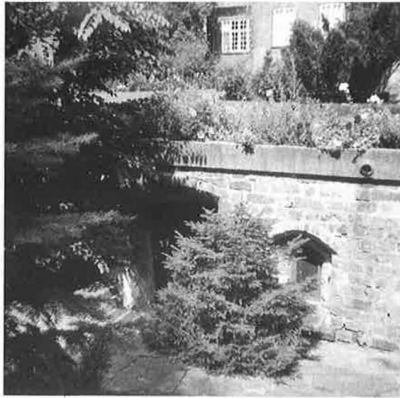
Ruinerne fra Sct. Clara Kloster i bispegårdens have.

stand, at den er tilstrækkelig stor til at rumme mange mennesker ved de særlige lejligheder, som der i årenes løb indfinder sig en hel del af, og alligevel ikke større, end at den danner en hyggelig ramme om familiens daglige liv. Og til huset hører en god have. Den er kun en beskedent rest af den oprindelige have, som gik helt ned til åen, men alligevel noget af en foræring midt i Odense city. I de første år var den domineret af et kæmpemæssigt kastanietræ; men i 1969–70 visnede det og måtte fældes. Det blev ganske dramatisk, for der var egentlig ikke plads til at fælde kæmpetræer i den have. Men heldigvis faldt det præcis, som sagkundskaben havde beregnet, så boligen og naboerne slap med skrækken.