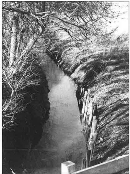
Hede-bækken, i dag mellem Gustav Johannsensvej og Zoologisk Haves parkeringsplads. I 1600-tallet var man på venstre side i Dalum birk, på højre side i Odense by. – Foto 2003.