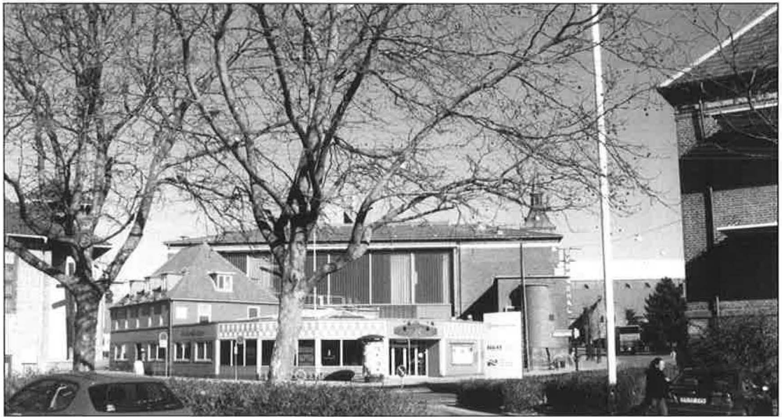
Munkemøllestrædes udmunding i dag. Foto 2003.

vendte birket tilbage til Odense herred.