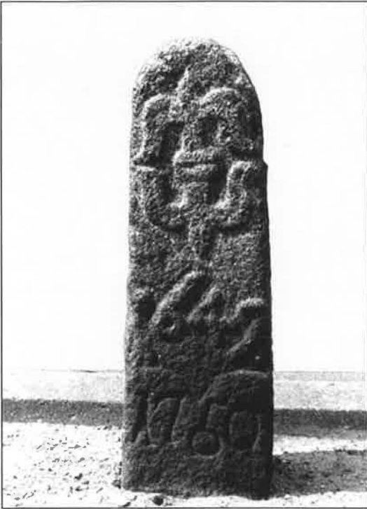
Byfredsstenen på Tolderlundsvej nær Helsingborggade. Stenen markerede grænsen for byens frihed/byfred – området hvor det var Odense byfoged, der dømte. Nogle steder gik grænsen tæt på købstadsbebyggelsen, andre steder langt ude. – Foto: Bjarne Mortensen (til Ove Jørgensens artikel i Fynske Årbøger 1982 om Odenses byfred).

Forfatteren har venligt oplyst, at han ikke fandt egentlig støtte i kilderne, da tinget omkring 1980 skulle findes, men at han vurderede herredets form og udstrækning samt navnet Ravnebjerg.