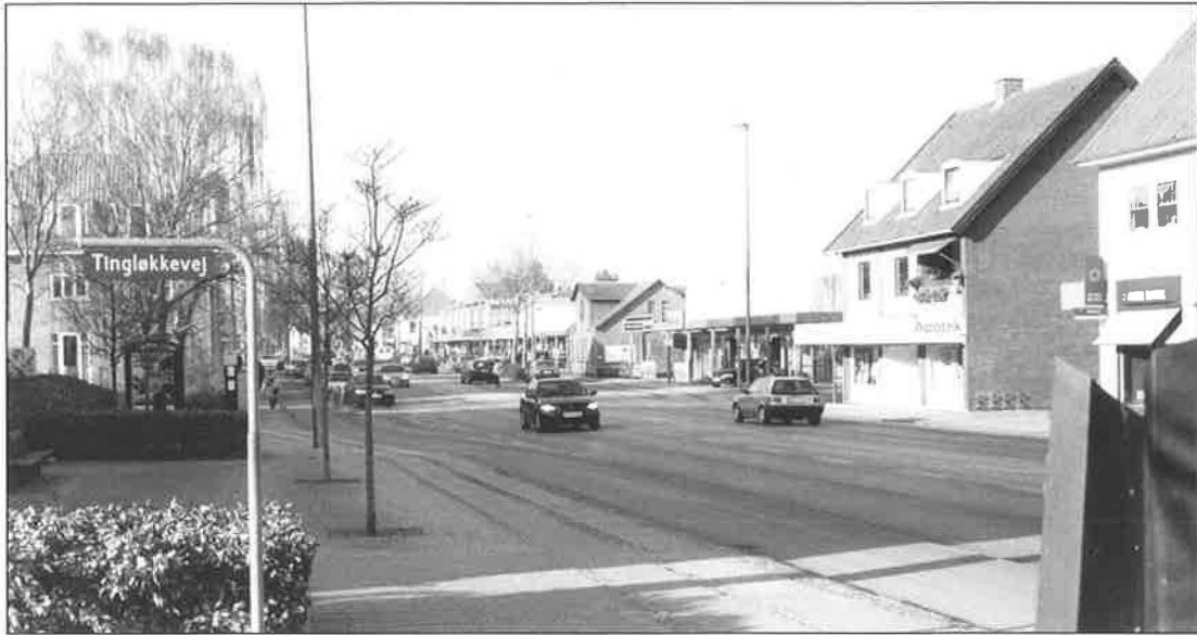
Dalumvej ved Tingløkkevej. I nærheden af apoteket og banken (til højre) må det gamle tingsteds hjul og støjle have stået – til skræk og advarsel for tinggæster fra to retsområder. – Foto 2003.

til 160 rigsdaler – heri medregnet en ikke færdiggjort skilning + enkelte andre fornødenheder. Alt var splinternyt, og på den varme sommerdag må det tætpakkede hus have duftet af friskhugget træ – og ler, der endnu ikke var helt tørt.