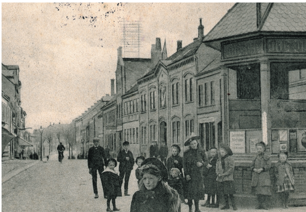
I en tid hvor fattige mennesker levede sammen på meget få kvadratmeter bolig, var børn henvist til at opholde sig mange timer i det offentlige rum. Her nogle tilfældige børn i en gade i Odense.

Danske Lov havde krævet. I stedet indeholdt §161 følgende bestemmelse: