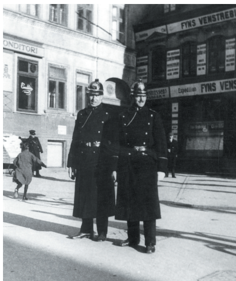
Den første halvdel af 1900-tallet patruljerede politibetjente hver dag i gaderne og fik dermed et nært kendskab til befolkningen. Det var dem, der mødte op, når børn var udsat for overgreb.

Statistikken kan naturligvis ikke belyse, med hvilke argumenter de retlige aktører valgte at betragte børnene som medskyldige. De kan heller ikke besvare, hvorfor nogle børn blev dømt, mens an-